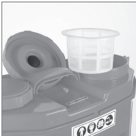
Фильтр (фильтрует осадок в пестицидах)